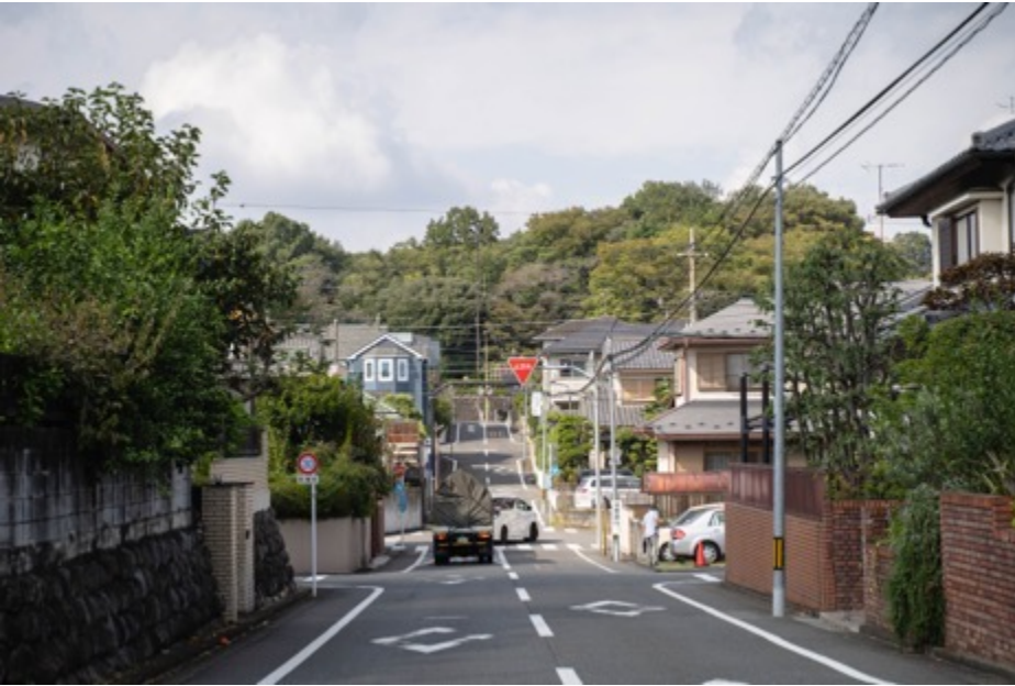
会館付近から万葉公園