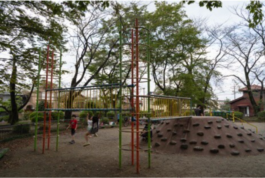
南公園・遊具のある広場