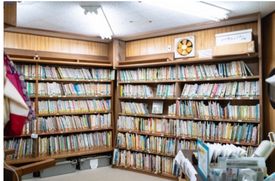
めじろ台子供文庫 (週1開館)