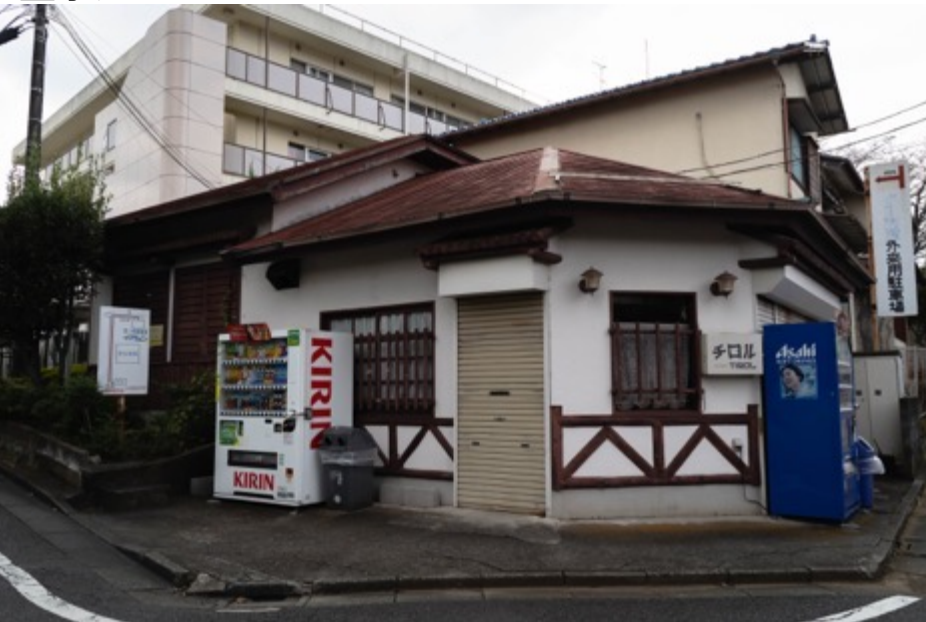
チロル跡地（集会所利用）