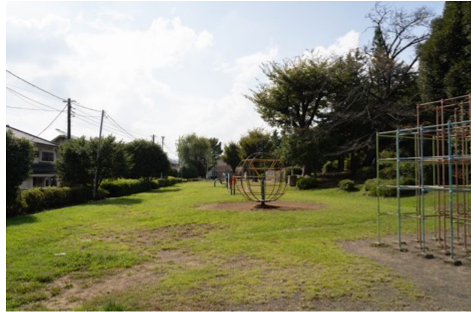
万葉公園南側スペース