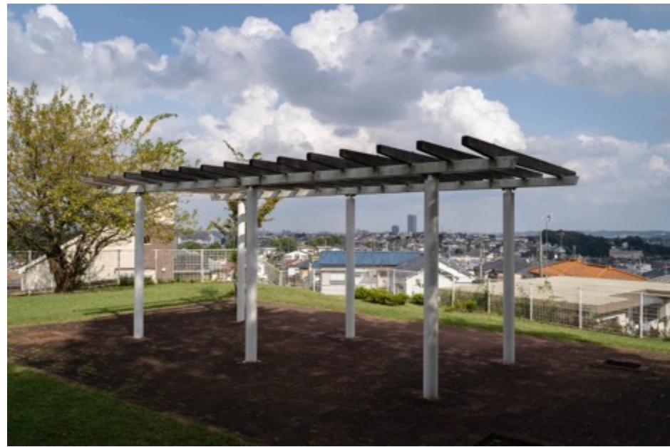
万葉公園展望広場