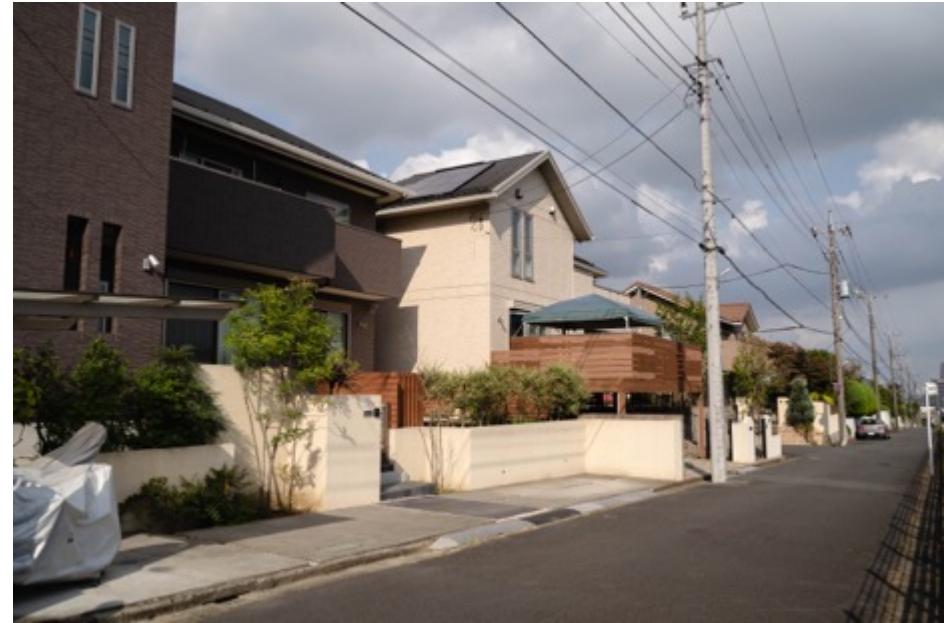
京王沿い街並み 比較的新しい住宅が並ぶ