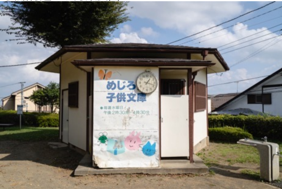
めじろ台子供文庫 (週1開館)