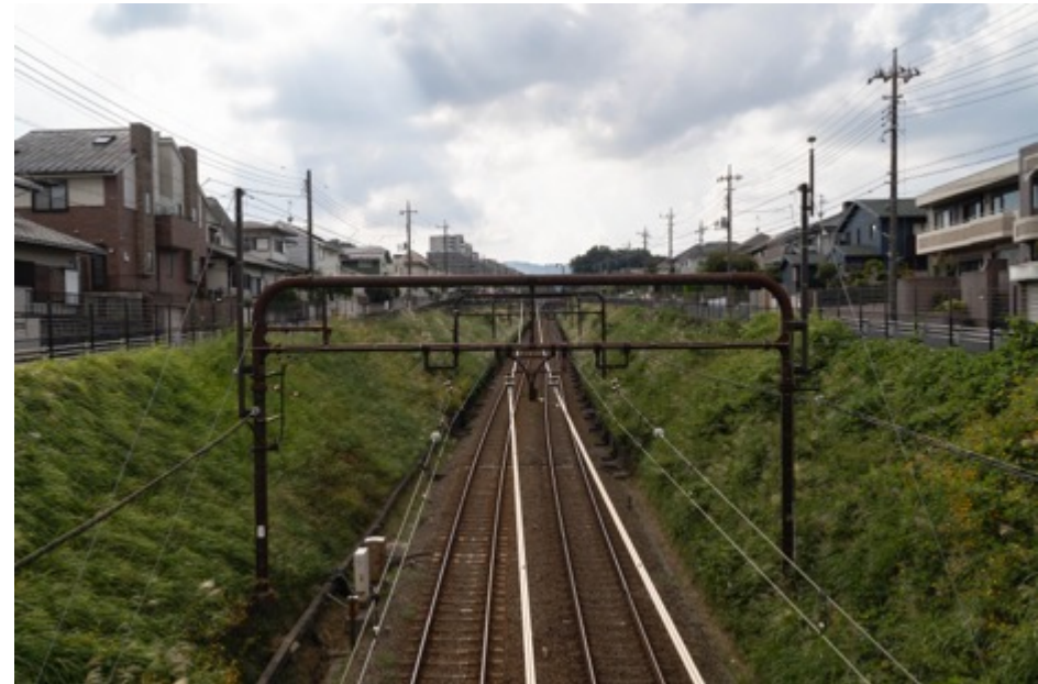
夕日撮影スポット