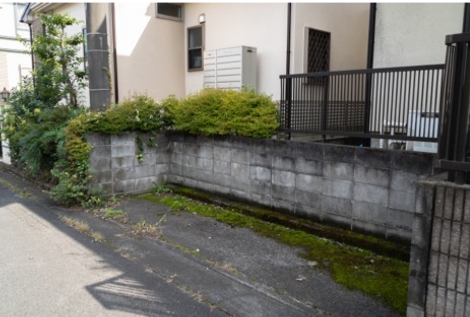
ゴミ置き場→ベンチ設置？