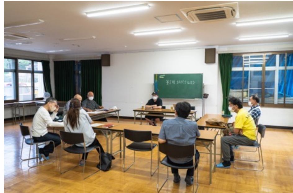
久しぶりの会館でのミーティング