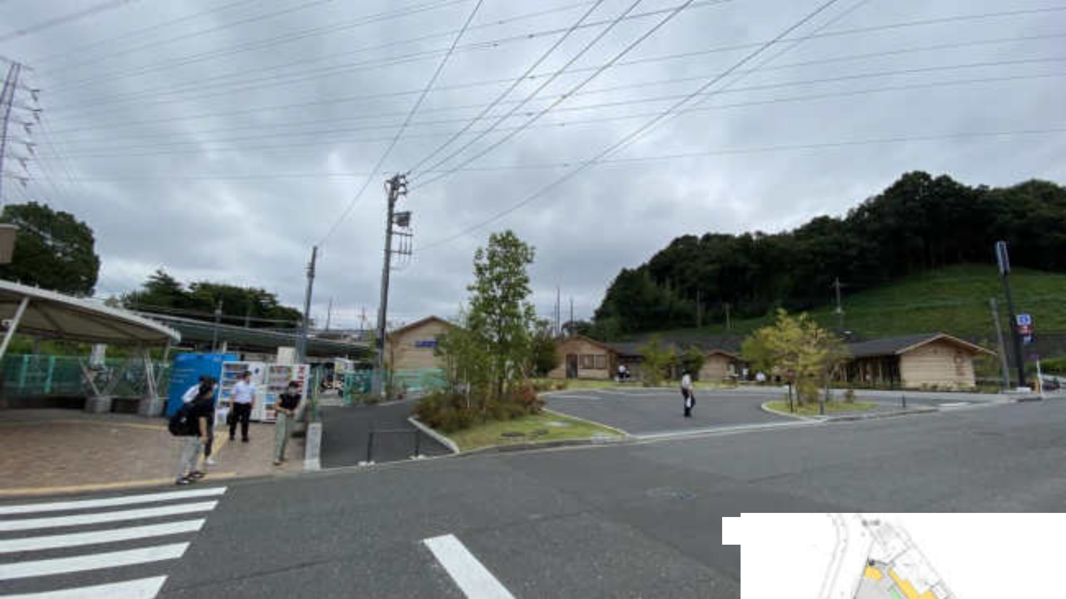
スクールバス専用ロータリー 桐朋学園