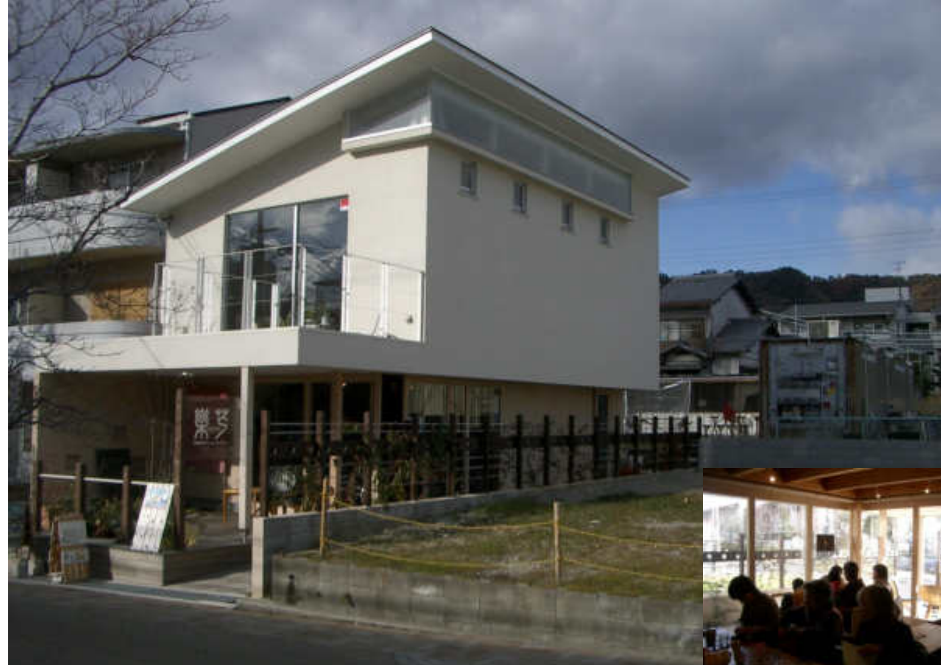
2005年 空き地の一角に コミュニティカフェを