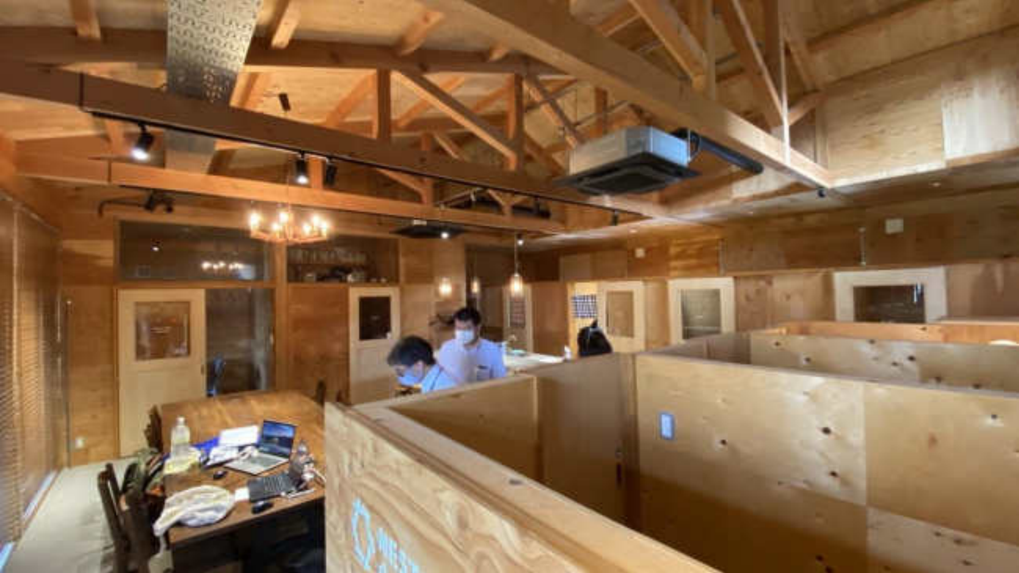
シェアスペースと個室 ハイパーパーティションとローパーティションの組み合わせ