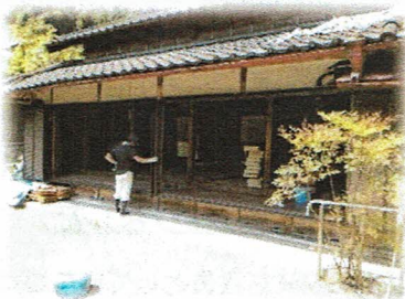
○原地区の空き家 “おもむろ”の再生

原地区の空き家“おもむろ”の再生を中心に、地域を盛り上げるため、農地や山林の再生に係る各種イベントや、大学等と連携してまちづくりの勉強会などを行っています。