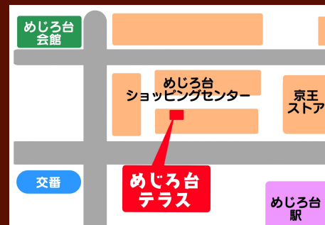
めじろ台ショッピングセンター内cafe5の隣