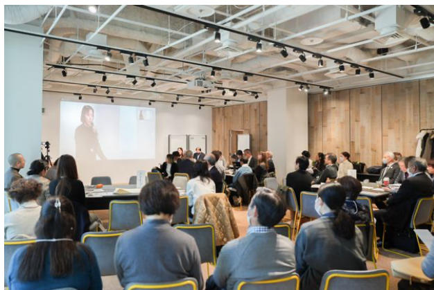
写真/活動報告の様子