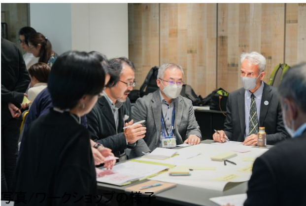
写真/ワークショップの様子