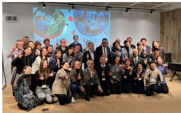
写真/交流会参加者集合写真